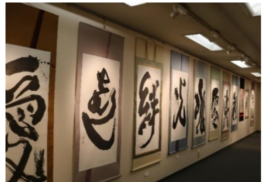
書画の迫力に惹かれて来場されるお客様も