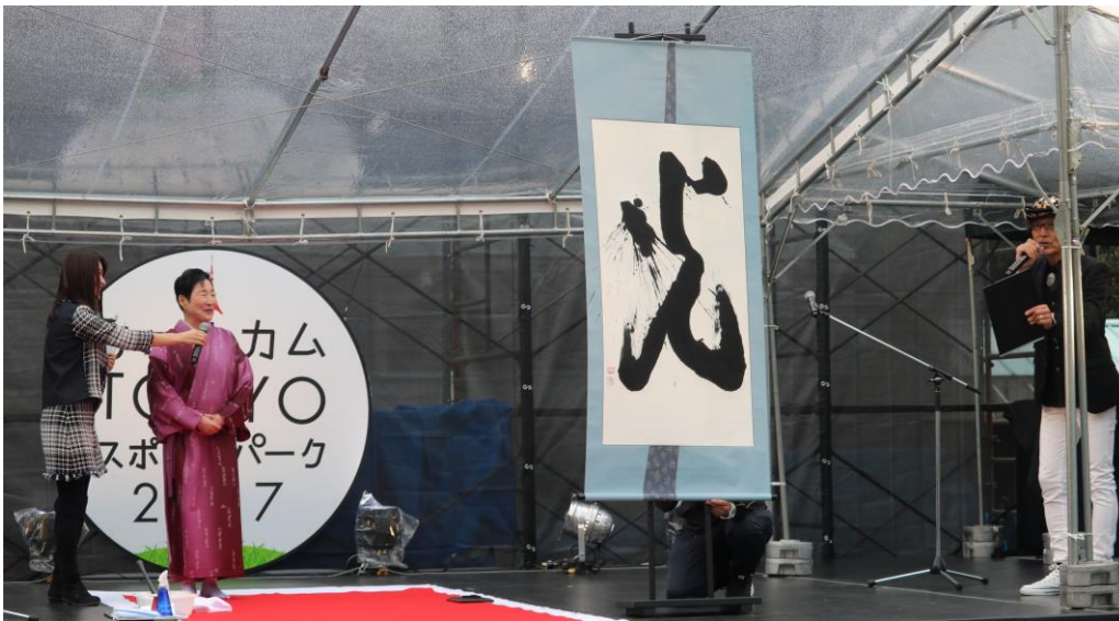
揮毫した「光」は、オリンピックの聖火ランナーのように見えるという声もありました