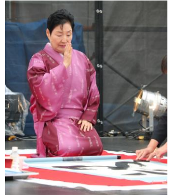
ちょうど雨が止み、揮毫ができました