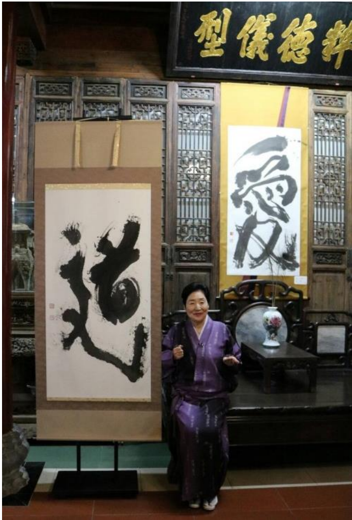
揮毫した「道」は萬粹楼博物館に寄贈しました

中国黄山市にて「黄山日中書画展」が開催されました。（黄山市美術家協会、全日本中国水墨芸術家連盟主催）黄山は、中国でも特別な土地とされています。その景観は山々が連なり、霧深く幽玄で、日本画でもよく見る水墨画の世界そのもの。また、古代の王・黄帝がここで仙人となったという伝説もあり、道教の修行道場が数多く存在する聖地でもあります。会場は、黄山の名所である萬粹楼博物館。中日国交正常化 45 周年を記念して、中日の作家の揮毫も行われました。