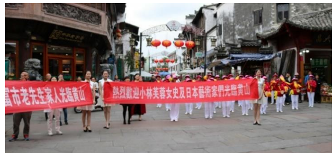
横断幕と女性音楽隊で出迎えていただきました