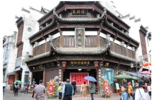
会場の萬粹楼博物館