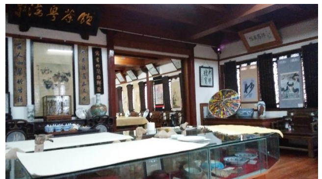
明などの貴重な文化財と一緒に展示されました