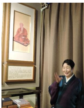
大興善寺博物館の空海像の前で