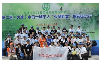
アカシアウォーキング大会会場で