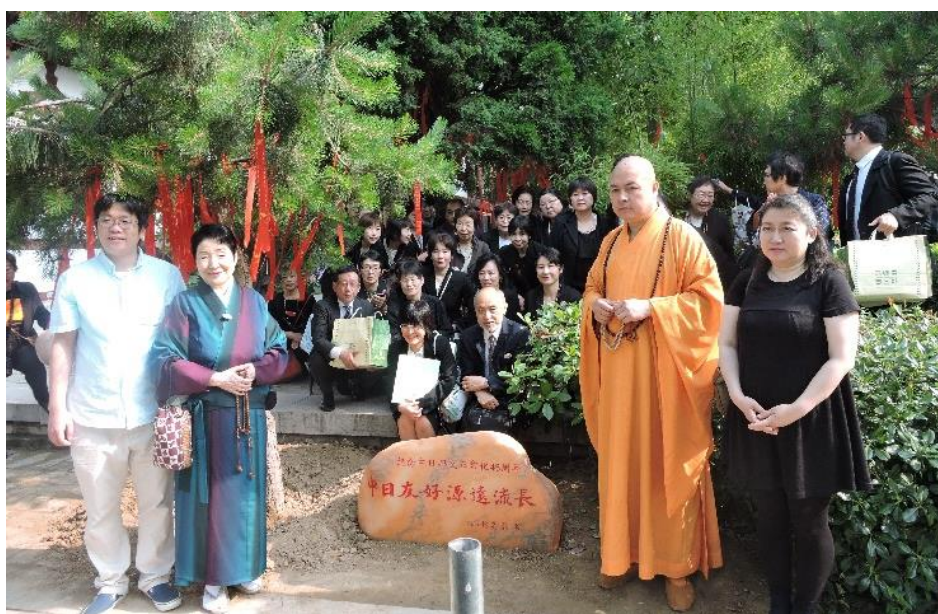
空海ゆかりの青龍寺で中日友好を願い石碑の除幕式