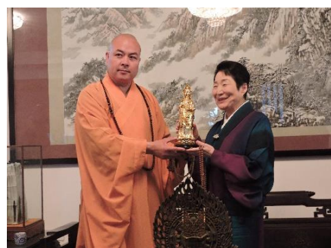
大興善寺の寛旭大阿闍梨様と